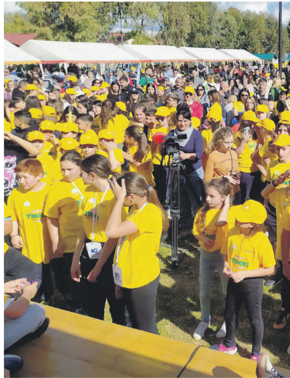
Il culmine del progetto in occasione del villaggio Coldiretti la prossima primavera

In tal senso l'album è stato sviluppato come un viaggio ludico ma anche didattico che compie un personaggio fumettistico chiamato Enea insieme al suo fidato amico a 4 zampe Orazio, che parte proprio dalla sede della Coldiretti, e che incontrerà diverse persone e luoghi nel suo percorso nelle terre pontine. È istruttivo non so-