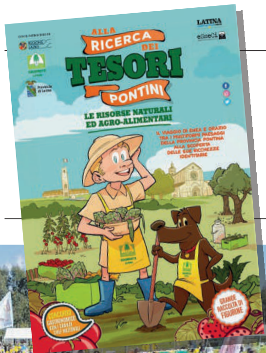
Pagine a cura di Martina Mennone